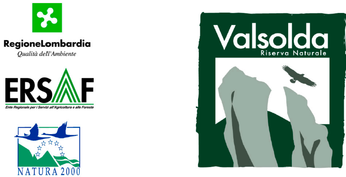
Tavola 4.1 I